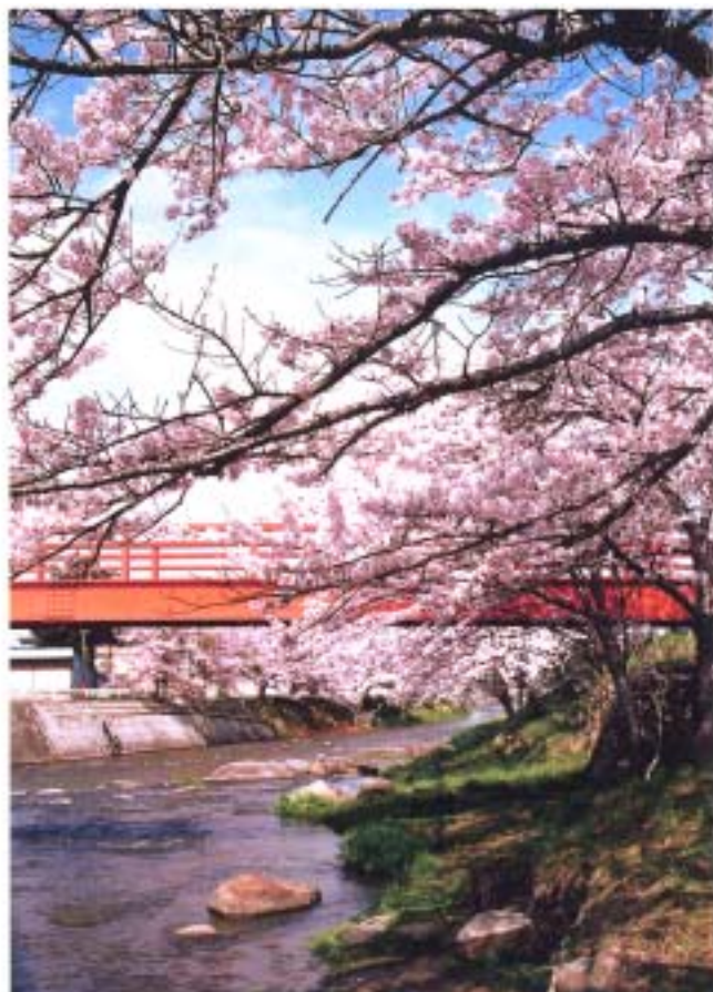
④ 大滝根河畔の桜並木 (船引)