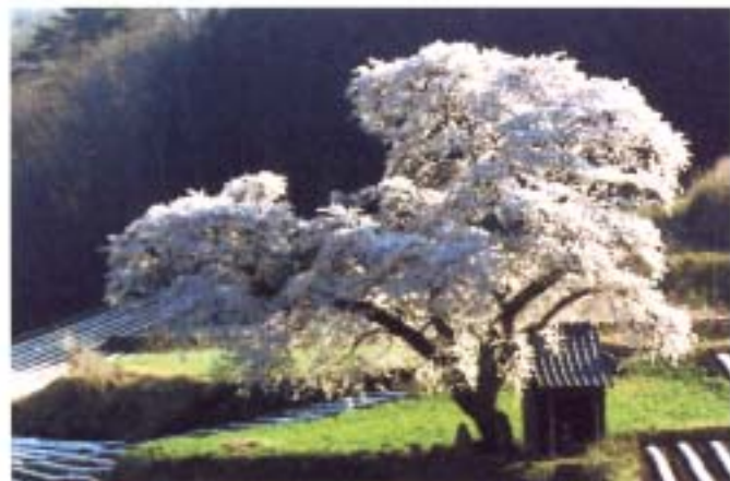
① 小沢の桜 (船引)