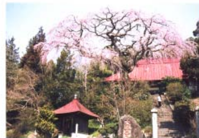
⑤ 大聖寺の紅しだれ桜 (笹山)