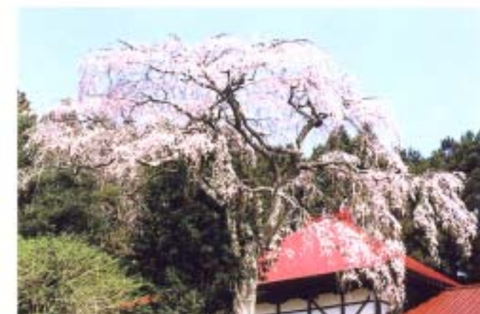
⑩ 萬福寺のしだれ桜 (文珠)