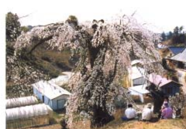
⑥ 壁須のしだれ桜 (芦沢)