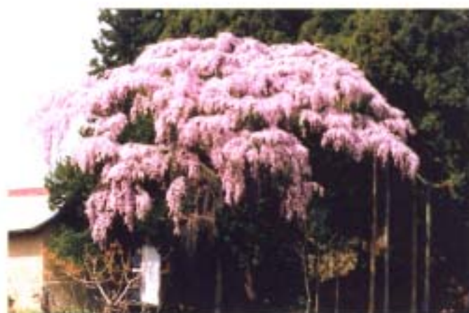
③ 仲森の紅しだれ桜 (笹山)