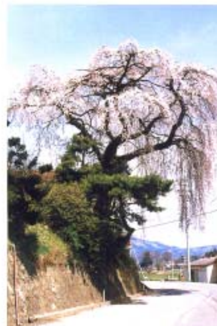
⑪ 小沢・宮のしだれ桜 (船引)