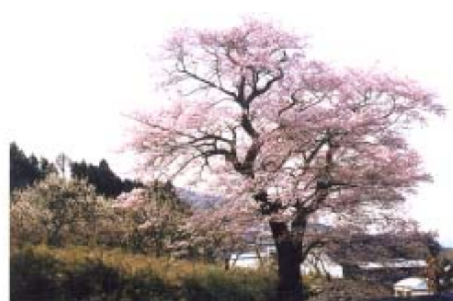
⑦ 花木内の桜 (船引)