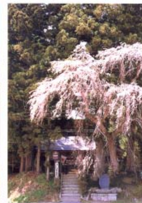
⑬ 堂山王子神社のしだれ桜 (門沢)