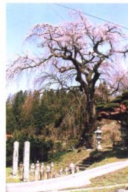
⑫ 松岳寺のしだれ桜 (南移)