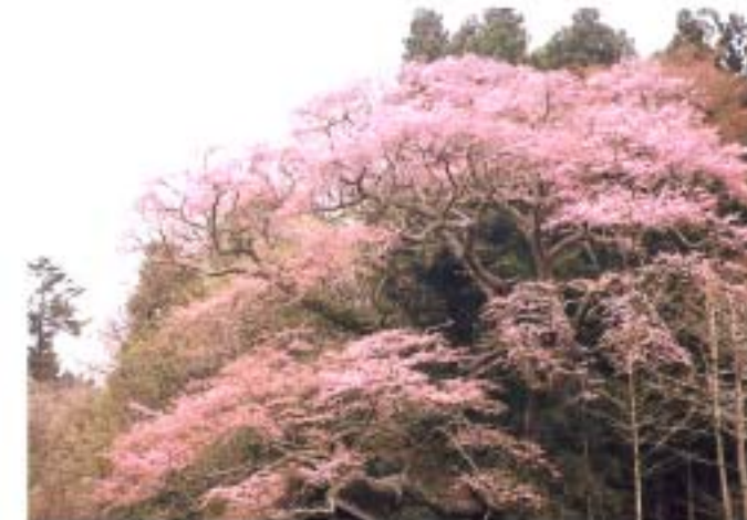
⑧ 下山田の桜 (芦沢)