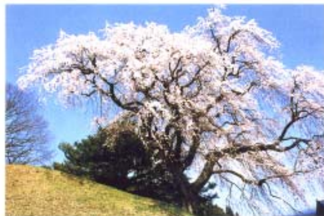
② 蛇塚のしだれ桜 (門鹿)