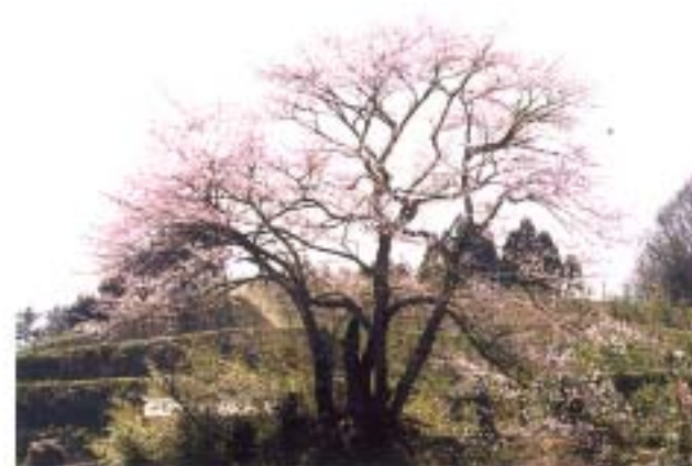
⑨ 光大寺の一里桜 (芦沢)