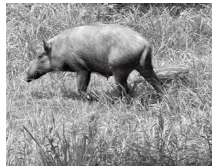
▲イノシシの成獣と幼獣

警戒心がとても強く、用心深い動物ですが、危険を感じたり、興奮したときには攻撃的になる場合があります。環境に慣れやすい面もあり、人が身近にいる環境に慣れると、行動が大胆になります。 →出会ってしまったときは、刺激しないようにしましょう。