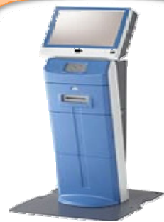
「証明書発行請求機」

タッチパネル式の証明書発行請求機を利用することにより、簡単に証明書の交付を請求することができます。係の者が操作方法をご案内しますので、是非ご利用ください。また、インターネットにより交付を請求することもできます（下記参照）。