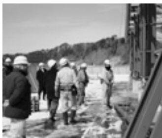
学校給食センター建設現場