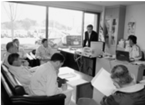
特別養護老人ホーム「船引こぶし荘」