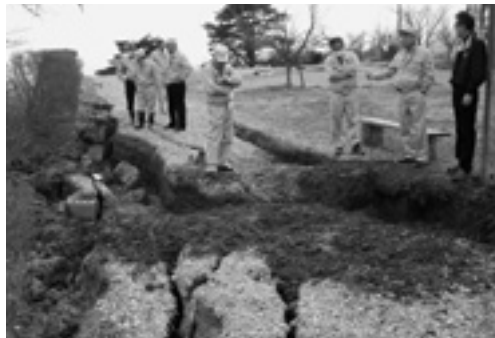
スカイパレスときわ (クロスカントリーコース)

ぎ、収束が見えない状況で、拡大する大気汚染、土壌汚染、風評被害等により、田村市の産業への影響が非常に大きく、どのような対策をすればいいのか見当がつかない状況下で、委員会ではまず何に取り組みなくてはならないのかを模索し、今後の所管事務調査を進めてまいります。