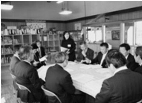
常葉児童生活センター