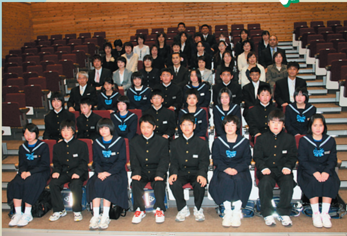
▲都路中学校入学式（常葉町 文化の館）