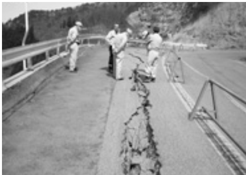
市道 一の坪あぶくま洞線

今回は、取り急ぎ目視できる被害状況視察を行い、早期に災害復旧を進めなければならぬと実感しました。特に、あぶくま洞は市の重要な観光資源であるため対応が必要であります。それ以上に甚大な被害をもたらす、目に見えない恐怖である原発事故問題があまりにも大き