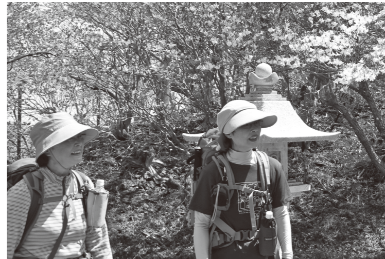
▲大滝根山山頂で花を眺める登山愛好家の方々 (5/17)

山々に新緑が広がり、本格的な登山シーズンが始まりました。市内では、5月17日に片曾根山と大滝根山で、24日には高柴山で山開きが行われました。この日を待ちわびた大勢の家族連れや登山愛好家などが、山道を登り、雄大な景色や新鮮な空気を満喫していました。 新緑や季節の花を愛でながら、心地よい汗を流してみませんか。