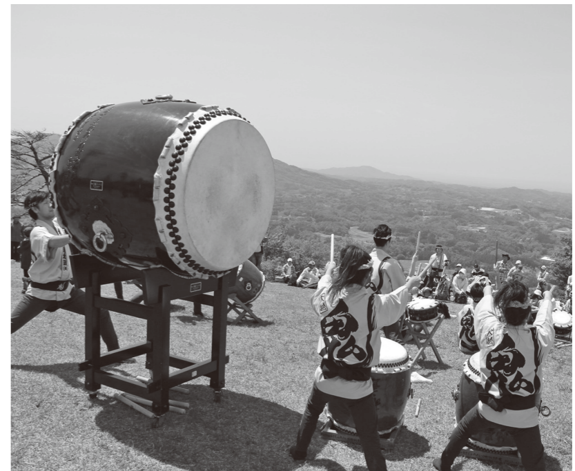
▲片曾根山では鬼五郎幡五郎太鼓の音が青空に響きわたりました (5/17)