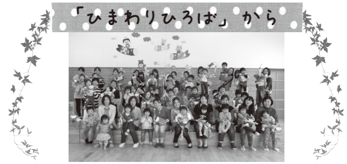
「ひまわりひろば」から 4月22日の「ひまわりひろば」は、こいのぼり作りをしました。62人の親子が参加し、歌や絵本の読み聞かせ、誕生会なども楽しみました。