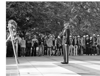
▲アーリントン墓地を見学