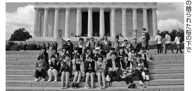
▲リンカーン記念堂前で記念撮影