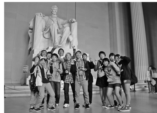
▲リンカーン記念堂のリンカーン像を臨む