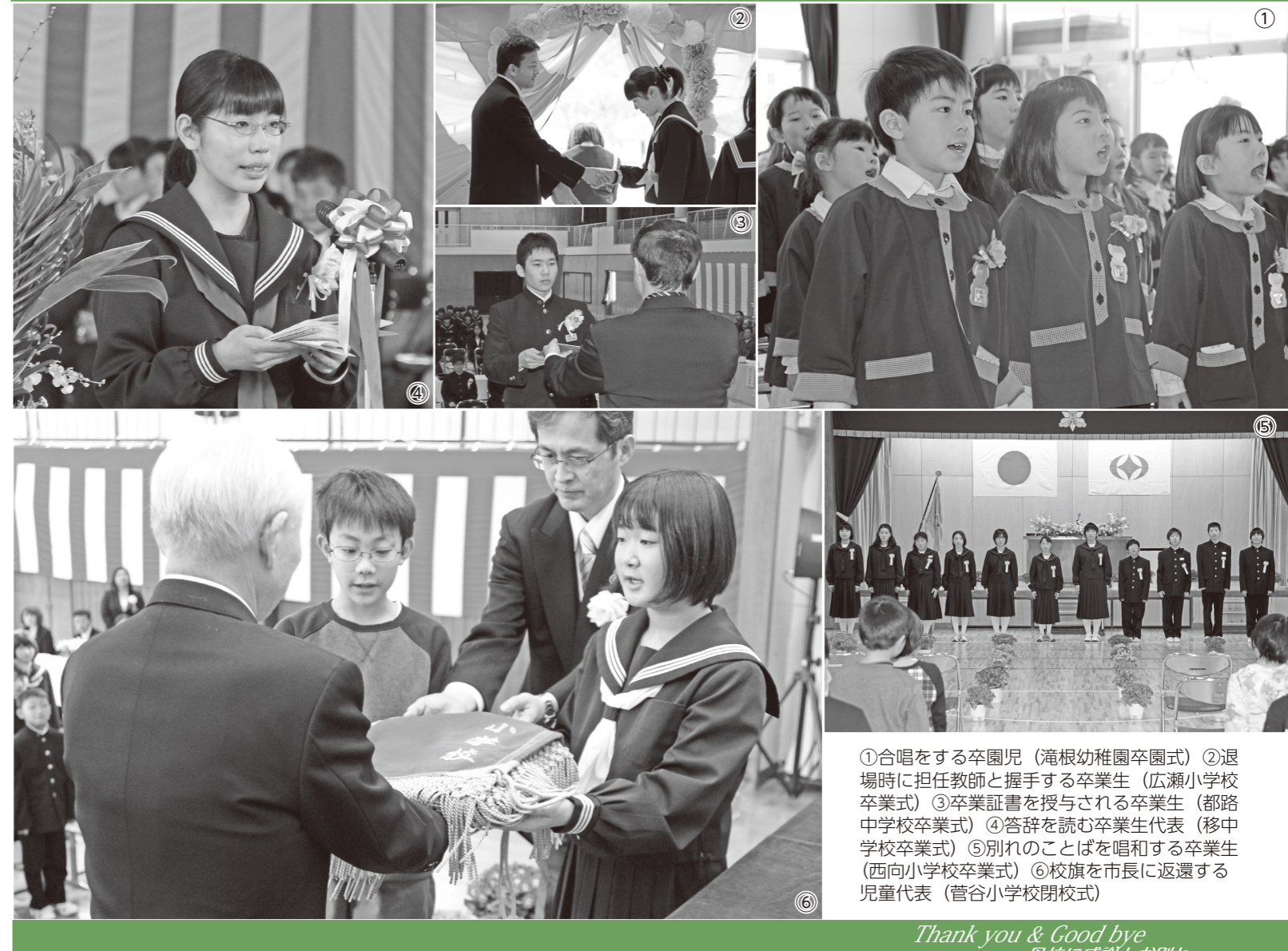
①合唱をする卒園児（滝根幼稚園卒園式）②退場時に担任教師と握手する卒業生（広瀬小学校卒業式）③卒業証書を授与される卒業生（都路中学校卒業式）④答辞を読む卒業生代表（移中学校卒業式）⑤別れのことを唱和する卒業生（西向小学校卒業式）⑥校旗を市長に返還する児童代表（菅谷小学校閉校式）