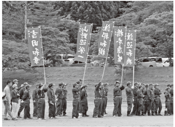
▲応援に駆けつけた多くの消防団員