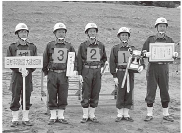
▲優勝した小型ポンプ操法出場選手