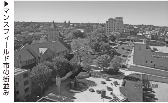
▶マンズフィールド市の街並み