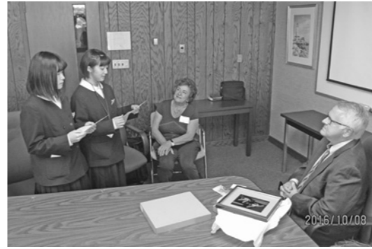
◀マンズフィールド市長へ 表敬あいさつ