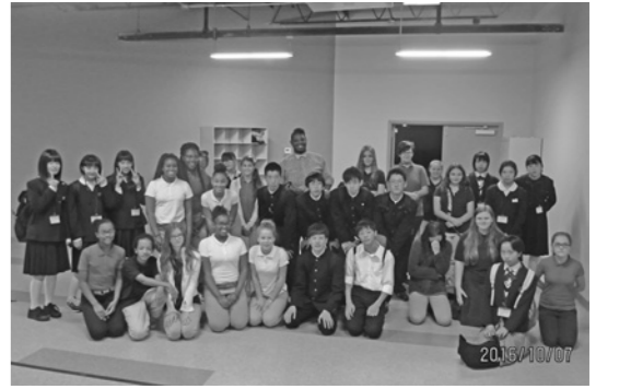
▶訪問した学校の中学生と 記念撮影

とても印象に残っているのは、家の中でも靴を履いていることでした。履いたまま過ごしていると、むしろこちらの方が良いかもと思えるほどでした。アメリカは、町ですれ違う人にも声をかけ、とても親しみやすいところでした。