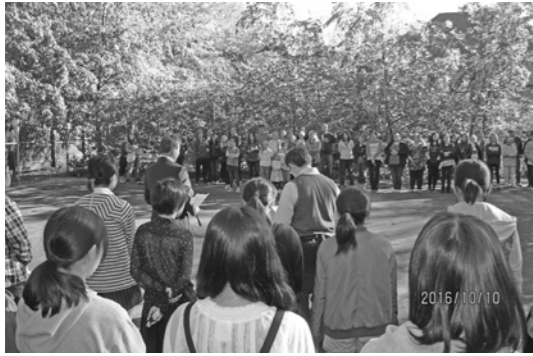
◀ホストファミリーとの さよならパーティー