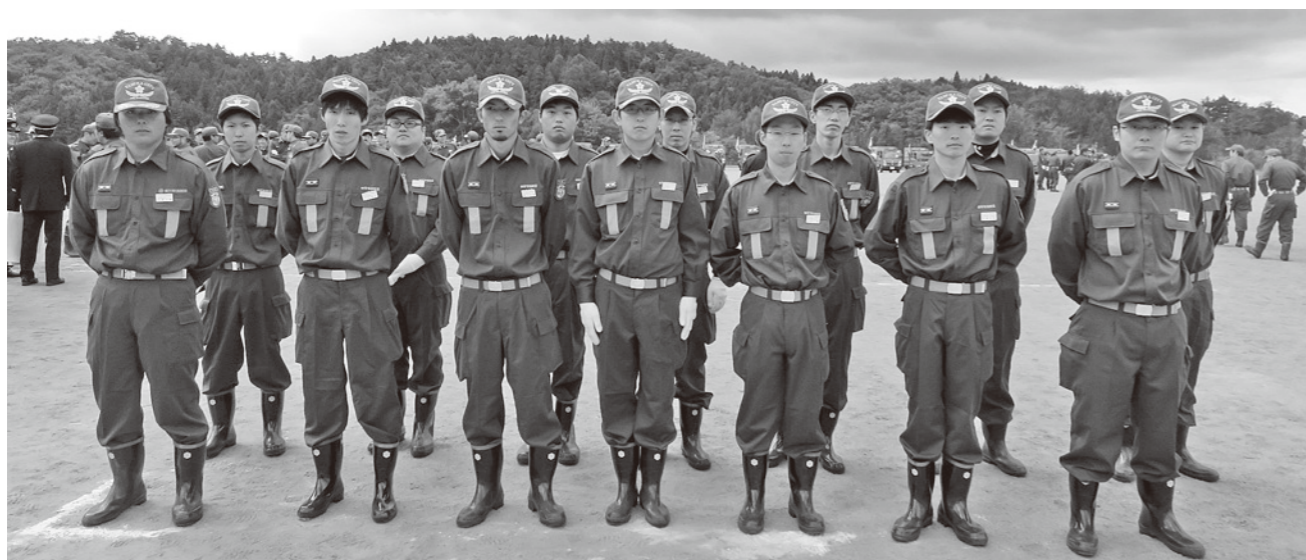
▲船引地区隊秋季検閲(昨年10月23日)に参加した新入団員

入団を希望する方は、お近くの消防団員または生活環境課 (☎ 81-2272) までご連絡ください。