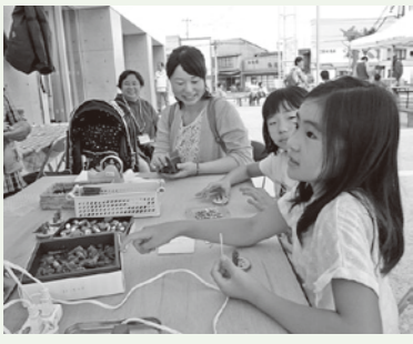
昨年の田村っ子ゆめまつりの様子