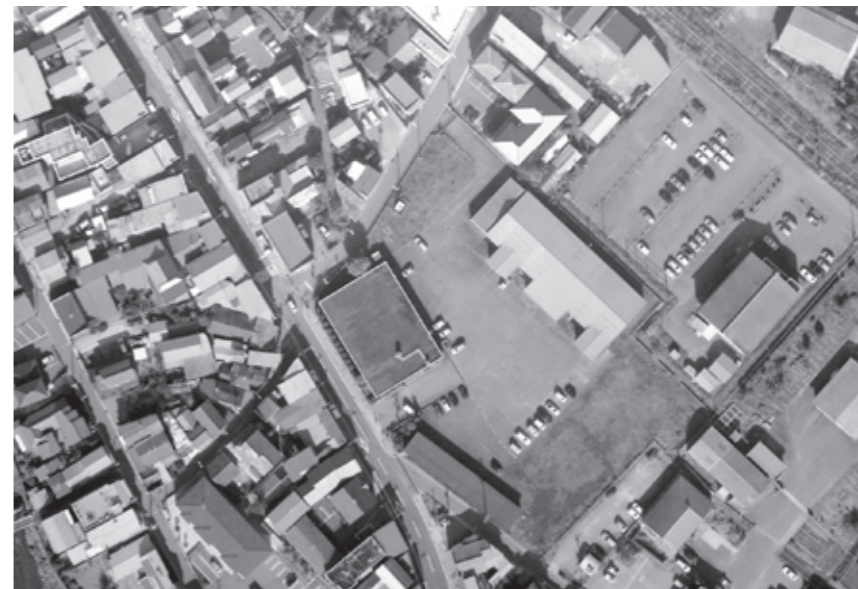
▲JR船引駅前の日本たばこ産業株式会社福島中央原料事務所跡地周辺

平成23年度は、既存建物の解体工事や行政区・各種団体長等で構成する庁舎建設検討委員会での基本計画や設計内容の調査・検討を経て実施設計を行い、平成24・25年度に本体工事を実施し、平成26年度のできる限り早い時期の運用開始を目標に、計画的かつ円滑に取り組む予定です。