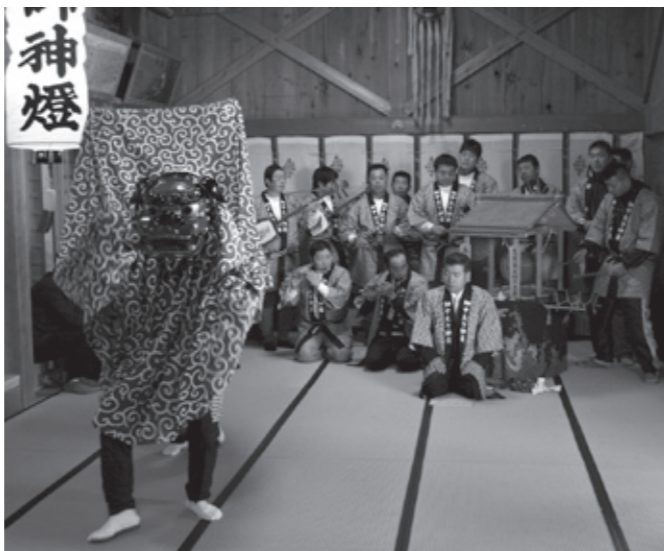
▲畑中大神楽保存会の皆さん

市教育委員会ではこのたび、滝根町菅谷地区に所在する「畑中大神楽」を市無形民俗文化財として新たに指定しました。 これで、市指定文化財は112件となりました。