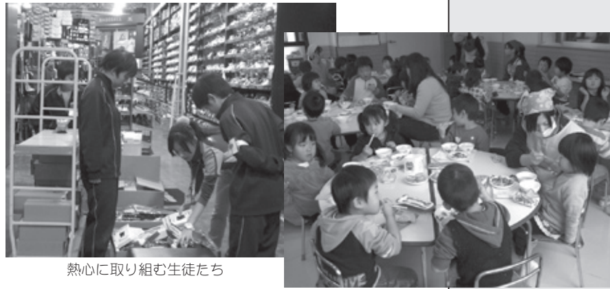
熱心に取り組む生徒たち

11月16日～18日にかけて、本校1年生29人がジュニアインターンシップを行いました。販売、保育、飲食業、美容関係など、多岐にわたる職種の体験をしました。初めは戸惑うことも多く、慣れない仕事に苦労することも多かったようですが、今回の体験を通じて、仕事のやりがいや楽しさを感じることができたようです。