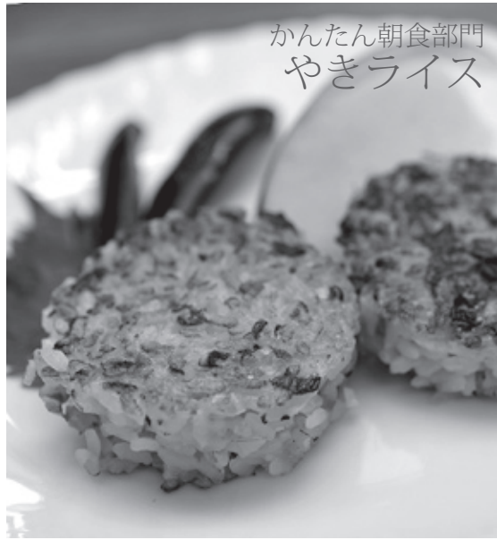
かんたん朝食部門 やきライス