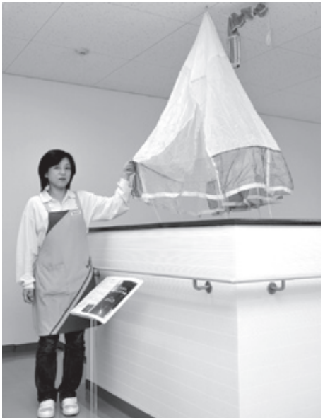
▲工場に展示されている実際のパラシュート

平成15年6月に打ち上げられ、7年もの長旅を無事に終え、昨年6月13日、無事地球に帰還した小惑星探査機「はやぶさ」。帰還カプセルにより持ち帰った微粒子を分析した結果、そのほぼ全てが地球外物質で、小惑星「イトカワ」に由来するものであるとされたこのニュースは、世界中を駆けめぐるとともに、平成22年を代表する面白い話題となりました。この「はやぶさ」の快挙を支えた、地球に着地するためのパラシュートは市内で生産されたものであることを皆さんはご存じでしょうか。