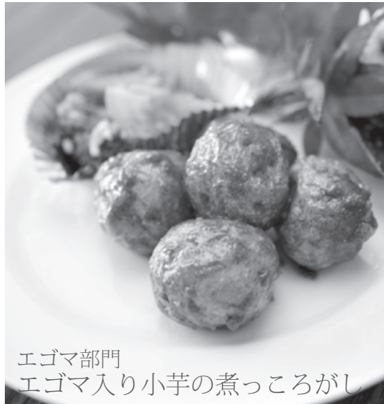
エゴマ部門 エゴマ入り小芋の煮っころがし