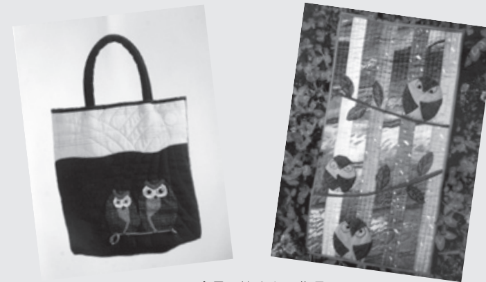
▲会員の皆さんの作品

当会は、毎月第1水曜日を定例会として、午後1時30分から約2時間、大越公民館でパッチワークを行っています。パッチワークとは、さまざまな柄布、素材、色、大きさ、形の小さい布を縫い合わせて、1枚の大きな布を作る手芸のことです。会員が心をこめて作った大きな布やバック、小物などの作品を毎年秋の大越地区文化祭に出品し、多くの皆さんにご覧いただいています。これからも物作り出す喜びを大切に、会員相互の親睦と交流を図りながら会の活動を盛り上げたいと思います。