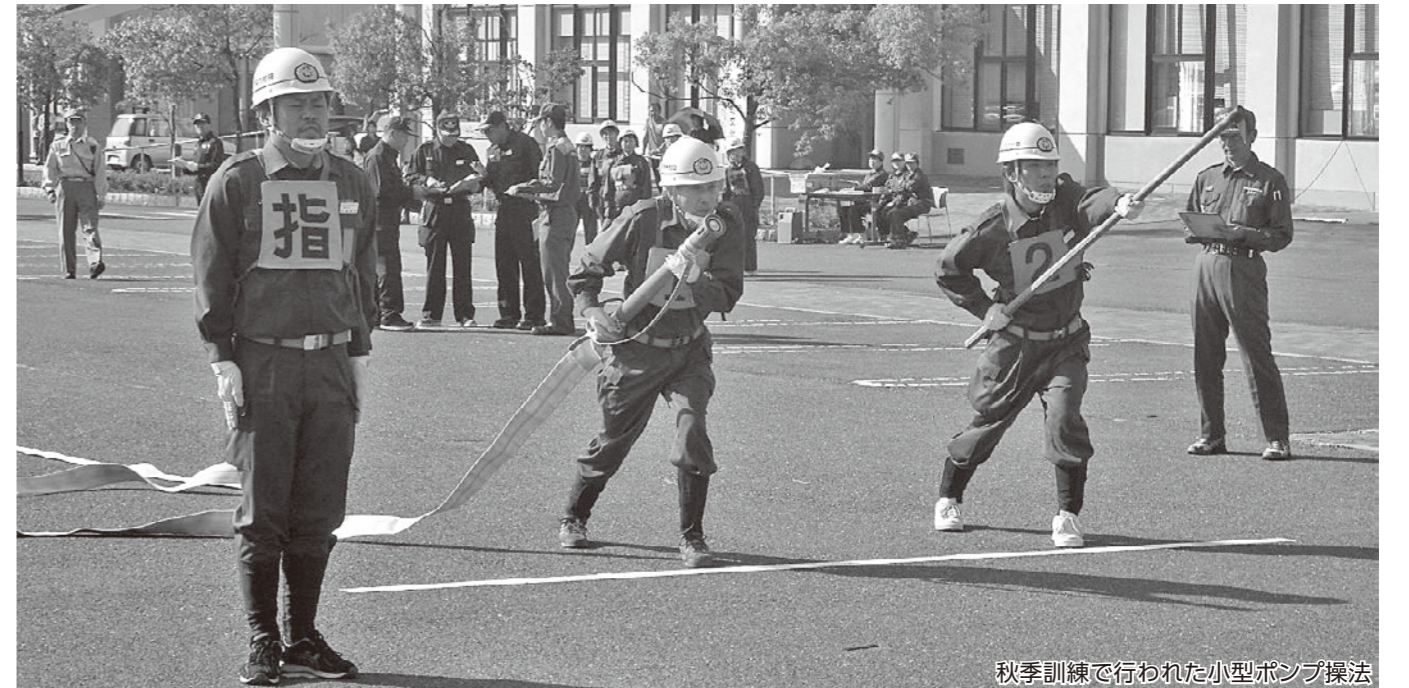
秋季訓練で行われた小型ポンプ操法

10/1 市総合防災訓練の後、秋季訓練を実施しました。 部対抗消防操法大会が行われ、小型ポンプ操法を6チームが競いました。大越地区隊では、田村市消防団ポンプ操法大会が開催されない年に、小型ポンプの部だけの操法大会を実施しています。団員は長期間の練習を積み重ね、練習の成果を発揮しました。 また、女性消防団員は軽可搬ポンプ操法を披露しました。短い期間で練習に励み、操法の基本をマスターしました。