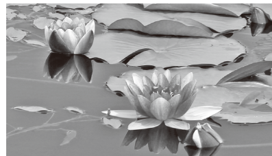
写真：松山高原に咲く蓮(6月25日撮影)