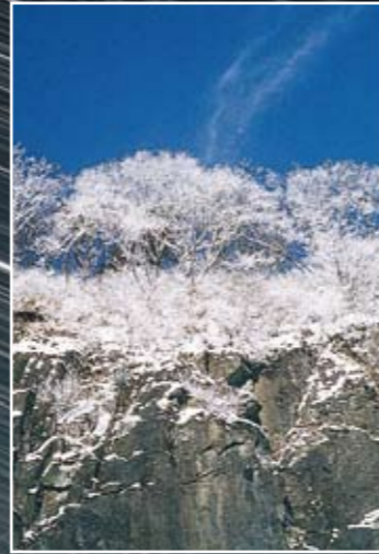
移ヶ岳の樹氷 冬の晴れた朝には、山頂付近で白い花のような美しい樹氷を見られることがあります。