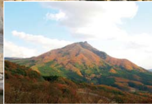
鎌倉岳 都路・常葉・船引にまたがる標高967mの山。鋭い岩の峰が特徴的で、東北百名山に選ばれています。