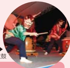
鬼五郎・幡五郎太鼓

長源寺の境内にある高さ31m、幹回り8mもの大いちょうは、樹齢370年を誇る古木です。市指定の天然記念物。