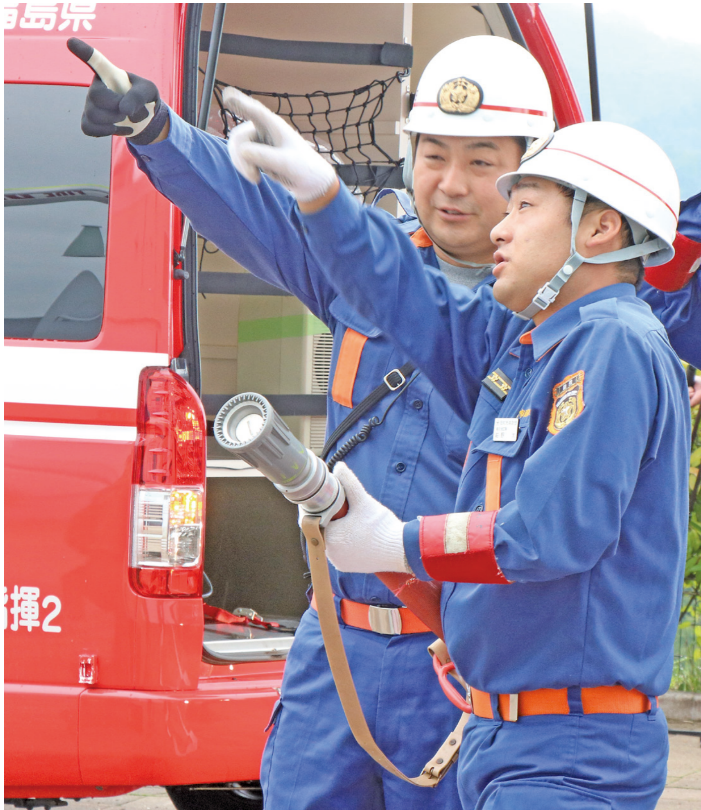
福島県総合防災訓練の火災防ぎょ訓練で消火活動を行う消防団員（9月2日 市運動公園 2～5ページに関連記事）