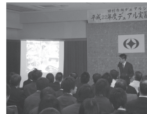
▲昨年度の発表会のようす