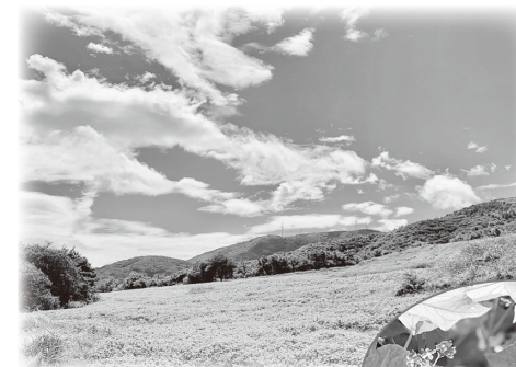
▲8月29日現在の赤そば 畑の様子

●場所 グリーンパーク都路 都路町岩井沢北向185番地1 田村市観光交流課 ☎81-2136