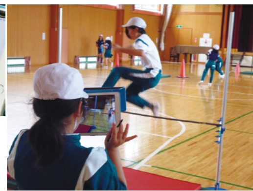
▲▲体育もその場でフォームを確認