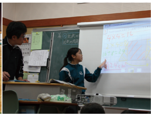
▲▲考え方をすぐに共有できます