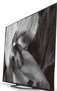
▲携帯やテレビなどの有機ELパネルに使用されています。※イメージ