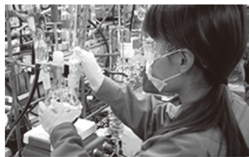
▲薬品を合成、精製して有機EL素材を作ります。

プラスチックなどの劣化を防ぐ紫外線吸収剤の生産において、国内外で高いシェアを誇るケミプロ化成株式会社。 滝根町にある福島工場では、新規の事業として有機EL素材と呼ばれる発光材料の研究開発と製造を行っています。この素材は有機ELディスプレイの製造に欠かせない材料です。有機ELディスプレイは省電力、高画質、薄型を実現し、従来の液晶ディスプレイに代わる次世代のディスプレイ