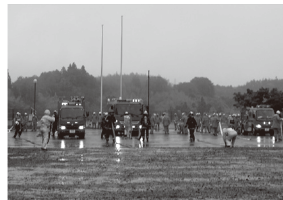
▲船引地域防災訓練

船引地区隊は地域での防災訓練や春季全国火災予防運動期間中に防火パレード・街頭啓発をしています。