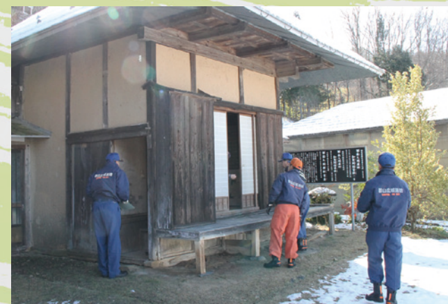
▲1月15・16日には、指定文化財を所有する寺社などを防火査察し、火災への備えを確認しました