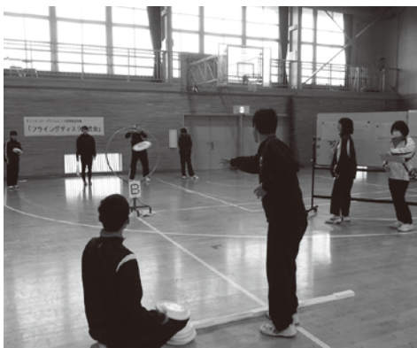
▲フライングディスク講座

本校では3年生を対象に、社会人として必要な知識・教養・技能を身に付け、共生社会に貢献できる心構えを醸成することを目的に「キャリアアップスタディ」を実施しています。