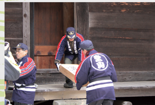
▲本殿内の貴重な史料を運びだします