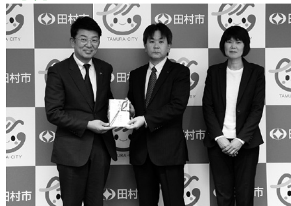
▲左から、市長、杉山社長、岡田専務