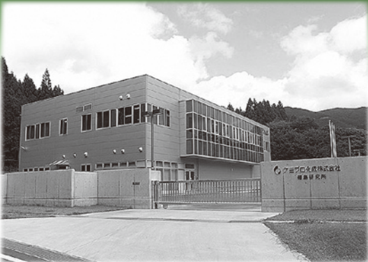
▲ケミプロ化成（株）福島工場外観

プラスチックなどの劣化を防ぐ紫外線吸収剤の生産において、国内外で高いシェアを誇るケミプロ化成株式会社。 滝根町にある福島工場では、新規の事業として有機EL素材と呼ばれる発光材料の研究開発と製造を行っています。この素材は有機ELディスプレイの製造に欠かせない材料です。有機ELディスプレイは省電力、高画質、薄型を実現し、従来の液晶ディスプレイに代わる次世代のディスプレイ