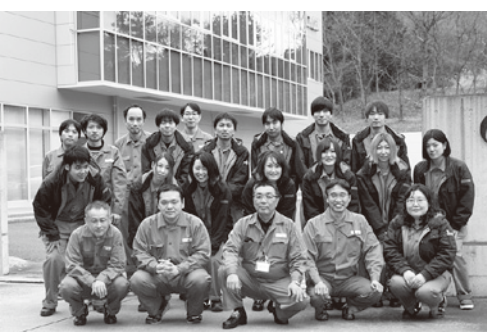
▲ケミプロ化成（株）福島工場のみなさん