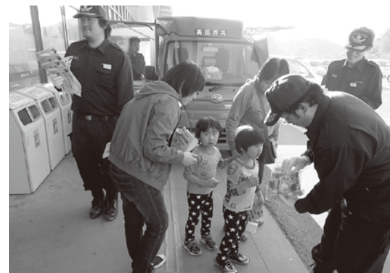
▲全国火災予防に伴う街頭啓発