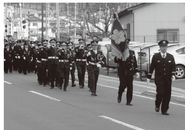
▲▼無火災祈願パレード

船引地区隊は1月5日、出初式を行い、その終了後に船引町の大鎗矢神社で、ことし一年の無火災を祈願しました。船引地区隊長以下、約100人の団員が誓いを新たに無火災を祈願しました。 無火災祈願終了後は、引き続き消防団員による無火災祈願パレードを行い、大鎗矢ふれあい公園から船引駅までを力強く行進し、火災予防を呼びかけました。