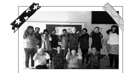
元気モリモリ体操「肩甲骨回し」を行っている参加者のみなさん

☎運動サロンサポート企業 (株)ルネサンス (コムスポ) ☎81-2130 保健福祉部 高齢福祉課 ☎82-1115