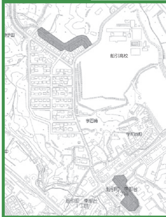
①船引町石崎、東部台地内