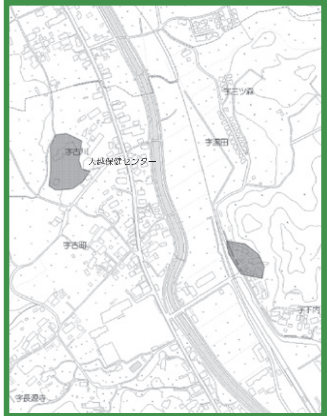
④大越町古川、下内地内