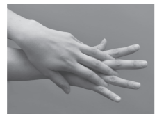
②手の甲を伸ばすように