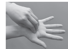
③指先・爪の間をよく洗う