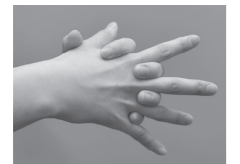
④指の間を十分に洗う