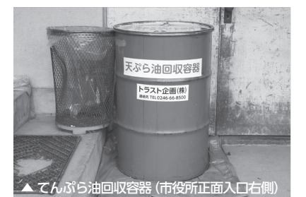
▲てんぷら油回収容器(市役所正面入口右側)