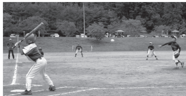
少年ソフトボール大会

第16回かぶと虫杯が開かれ、今年も市内外から多くのスポーツ少年団が参加し、熱戦が繰り広げられました。