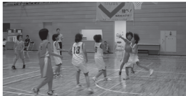
ミニバスケットボール大会

結果：(かぶと虫ブロック) 優勝…御木沢スポーツ少年団(三春町) 準優勝…大越町ソフトボールスポーツ少年団(田村市) 第3位…関本ソフトボールスポーツ少年団(田村市) 第3位…永盛ソフトボールスポーツ少年団(郡山市) (クワガタブロック) 優勝…三春ソフトボールスポーツ少年団(三春町) 準優勝…常葉エンジェルススポーツ少年団(田村市) 第3位…七郷スポーツ少年団(田村市) 第3位…岩江スポーツ少年団(三春町)