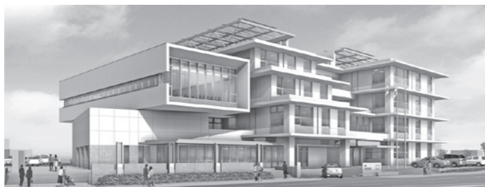
本庁舎の外観イメージ