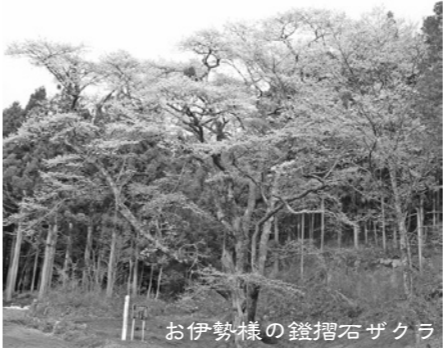
お伊勢様の燈摺石ザクラ