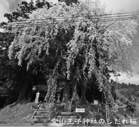
堂山王子神社のしだれ桜