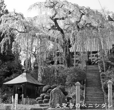
大聖寺のベニシダレ