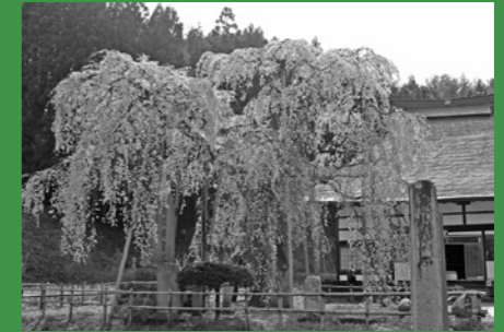
写真上(小沢の桜) / 写真下(永泉寺のザクラ)