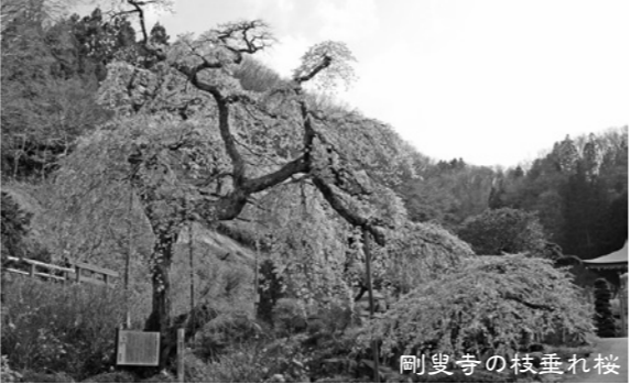
剛叟寺の枝垂れ桜

4月から市ホームページに市内の桜の開花情報を掲載します。見ごろの確認などにご利用ください。 http://www.city.tamura.lg.jp/