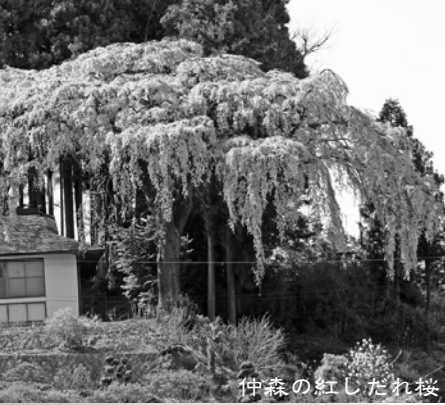
仲森の紅しだれ桜