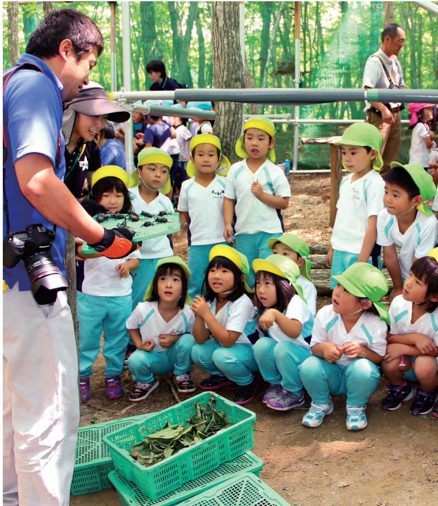
カブトムシ自然観察園の放虫式で、黒光沢のカブトムシに興味津々の常葉幼稚園の子どもたち(7/12 こどもの国ムシランド)