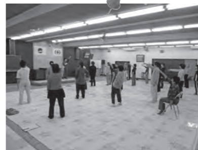
▲昨年度の教室の様子

昨年度から、全12会場で生活習慣病予防教室を実施しています。昨年は総勢204の方が参加し、「また参加したい」などと多数の方から好評いただいています。また、教室終了後3カ月運動が継続できた方に、達成証を交付しています。昨年の達成者は、28人でした。達成者の方から「台所に行くとき、自然と体が動くようになった」「体を動かすのが楽しく感じるようになった」「体重が減り、体調が良くなった」などの感想がありました。「時間がなくて運動が続かない」などと悩んでいる方は、ぜひこの教室に参加し、生活の中で無理なく続けられる運動を見つけ、3カ月続けてみませんか。