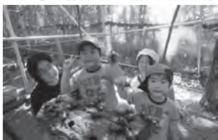
「カブトムシ自然観察園」