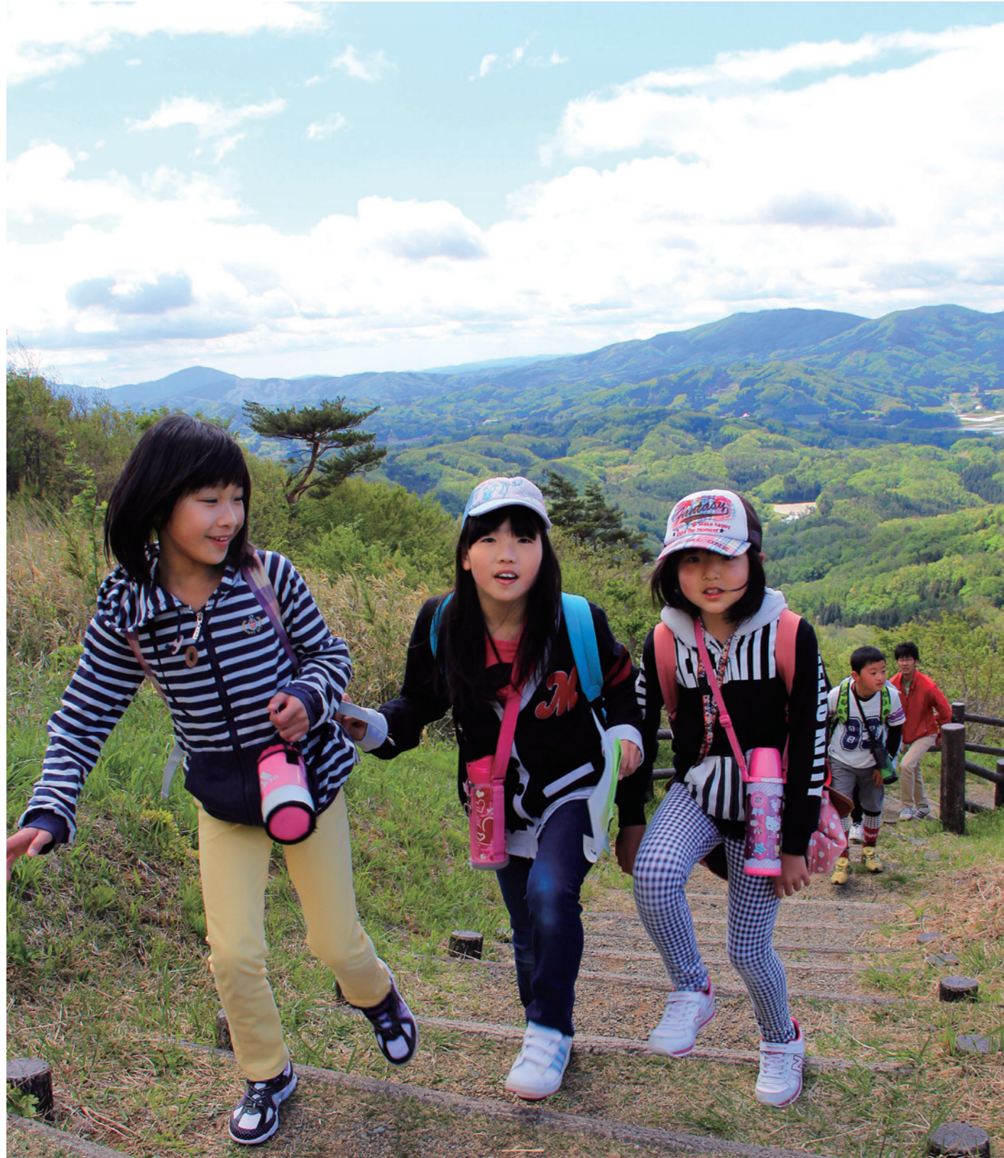
遠くの山々が見渡せる澄んだ青空の下、多くの家族連れや友達同士が爽やかな高原の風を受けながら山登りしました。(5/18 片曾根山山開き)