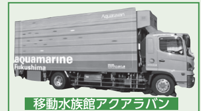
移動水族館アクアラバン