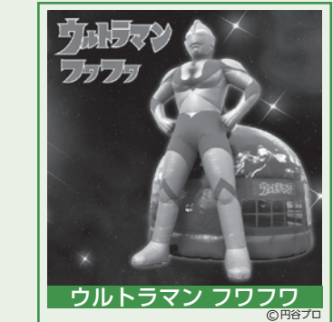
ウルトラマン フワフワ