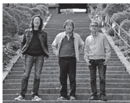
企画:ネクストワン/ウィスパERM्यूジック 制作:エターナルラインプロジェクト 後援:ユニバーサルミュージック/ ASTURIAS CONCERT GUITARS ロックマン 協力:武田鉄矢ファンクラブ

※市民に限り、重度心身障がい者割引があります。 ※チケットを購入希望の方は、市文化センターまたは、各公民館へお問い合わせください。