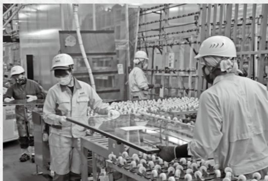
ガラスの外側にレージングチャネルと呼ばれるゴムを取り付け、気密性を保ちます。 田村市で生まれる優れた製品を募集しています。商工課までご連絡ください。

全国に18カ所の製造拠点と5カ所の営業拠点があり、当工場では1日に約1000枚のガラスを製造しています。製造された窓ガラスは、市内の小学校や田村市役所など、身近な所で使われています。