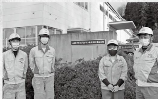
▲地元の高校から新卒で入社した社員3人と工場長