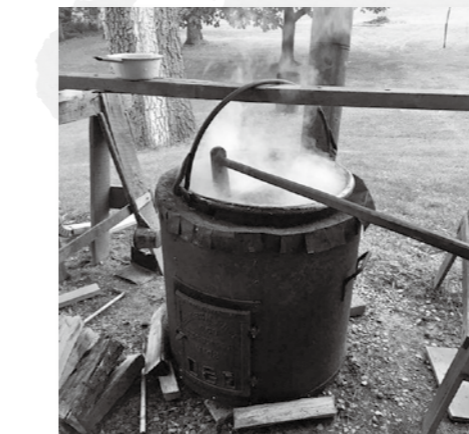
▲ 100年使われている大釜と代々伝わる混ぜ棒

朝もやがまだ地面を覆い隠し、紡がれたようなとうもろこしの毛に朝露が輝く爽やかな朝に、私は農場の納屋へ車でゆつくり向かいます。入れたてのコーヒート調理火の豊かな温かさを思い浮かべながら、畑や森を抜けてゆるやかに曲がる道を通ってようやく農場に到着すると、すでに何人が集まっています。昨夜も一緒だった人もいれば、明るくなってきた朝の光りの中で初めて会う人たちもいました。