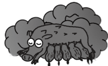
出産・子育て場所