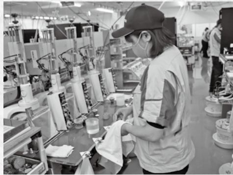
▲レンズを機械にセットして磨き上げます

大越町で精密光学機器メーカー「トプコン」の測量機や眼科用医療機器などに使われる光学レンズやプリズム、光学ユニットなどを製造する株式会社トプコンオプトネクス。光学レンズ・プリズムは、ガラスの材料を「削る、磨く、膜を付ける、貼り合わせる、出荷検査」など、いくつもの工程を経て完成します。現在は、高画質（4K、8K）対応のシネマ用レンズや、高倍率の監視カメラ用レンズなど、高い精度が求められる製品の加工依頼も多く、作業者が長年の経験と技術で、これらの高精度製品を生み出しています。また、新たに、目の病気を早期発見するために使用される眼底カメラのレンズ（非球面形状）の生産を開始し、主力の製品となっています。