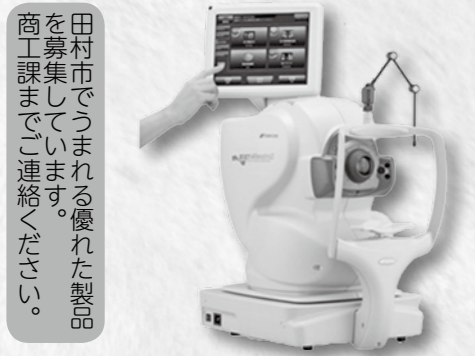
▲主力製品は眼底検査機器に使用されるレンズです