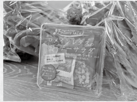
▲首都圏を中心に販売予定のカップサラダ