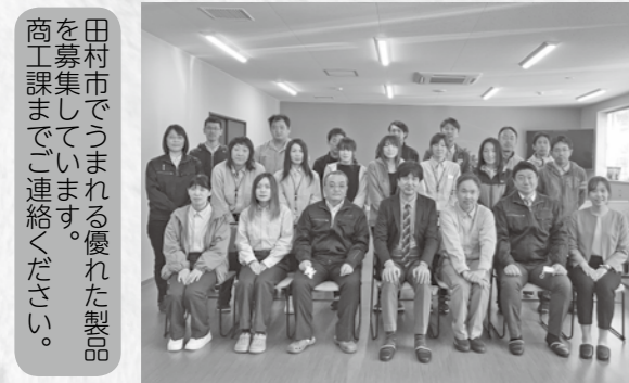
▲株式会社A・P・I・U・Sの皆さん