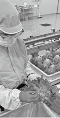
▲レタスの出荷準備をします