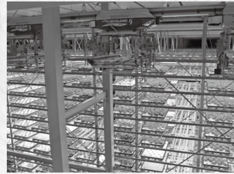
▲モノレールが自動でレタスを搬送し、各作業ロボットが待つ部屋に移送します