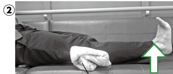
タオルまたはボール