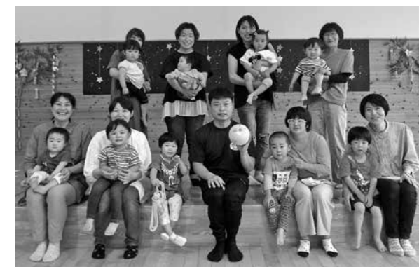
「育児講座」親子で体をたくさん動かして遊びました!