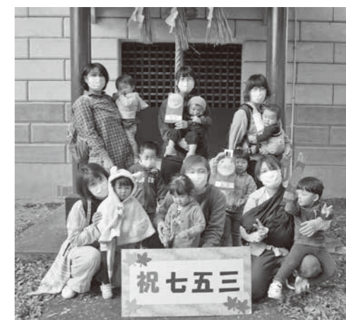
七五三のお祝いをしました♪みんなすくすく大きくなあれ!

「遊びの教室」以外でも自由にご利用ください。 ※感染症対策のため検温・マスクの着用にご協力ください。