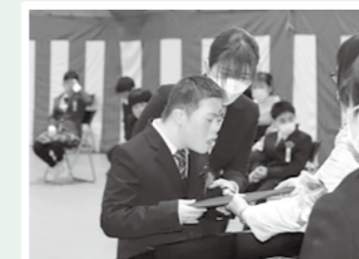
【中学部 卒業証書授与式】