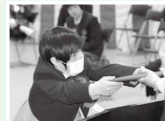
【小学部 卒業証書授与式】

3月18日に小学部・中学部の卒業証書授与式を挙行了しました。小学部児童は、たむら支援学校の中学部へ、中学部生徒は、たむら支援学校高等部や他校の高等部へ進学し、新しい目標をもって毎日楽しく、元気に学習しています。