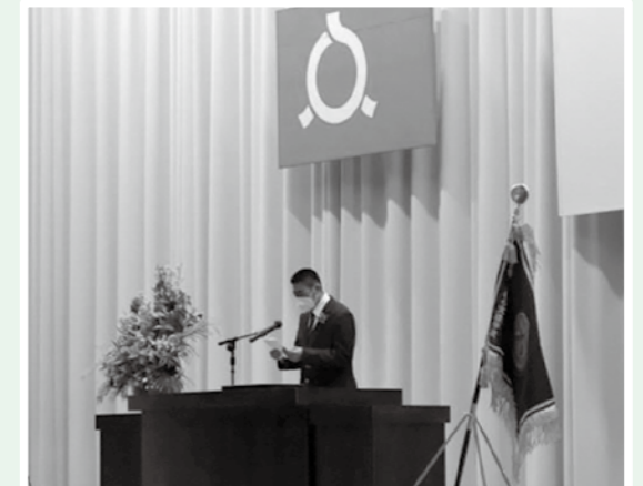
【高等部卒業生 答辞】