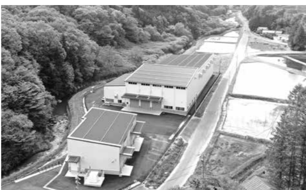
▲手前：古道ライスセンター、奥：米流通合理化施設