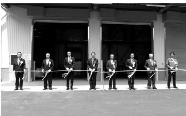
▲落成式テープカットの様子

米流通合理化施設と同一敷地内に整備されました。乾燥調製機、穀粒選別機、色彩選別機、粉摺り機等が一連のラインを形成し、最大20トン/日の処理能力を有します。