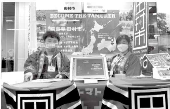
移住イベント出展の様子

じています。思い返せば、子どものころから地域住民の皆さんの温かさ、滋味あふれる食材、日本らしい春夏秋冬を感じられる気候に触れ、大らかに育てていただいたなど、今はこの土地に大変感謝しています。そしてこれからは、地元で育んでいたご恩をお返ししたいと思い、長い旅から戻って参りました。今はまだ、何ができるか模索中の日々を過ごしていますが、これから田村市のために尽力していきますので、改めて、よろしくお願ひします。