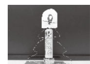
ファラデーモーター