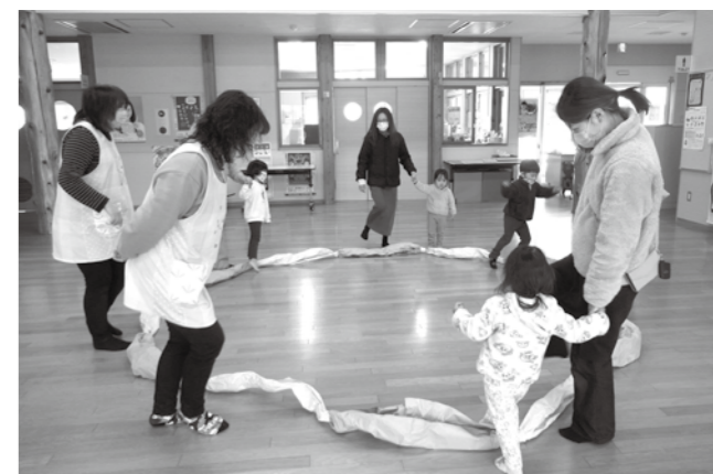
~遊びの教室の様子~