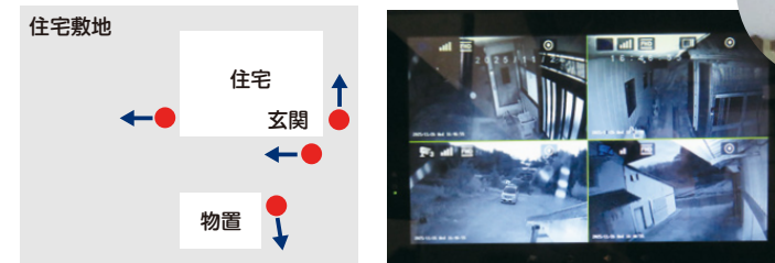
防犯カメラ設置図 ●防犯カメラ ←撮影方向

昨年8月、市の防犯対策補助事業を活用し、ご自身の住宅敷地内に、4台の防犯カメラを設置した市民の方に導入したきっかけや活用方法を伺いました。