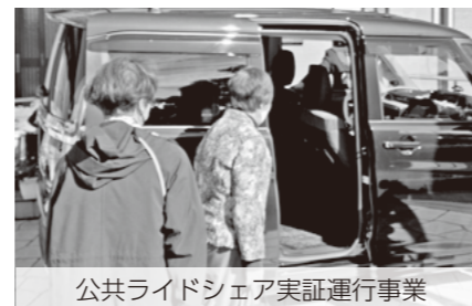
公共ライドシェア実証運行事業