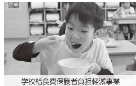
学校給食費保護者負担軽減事業