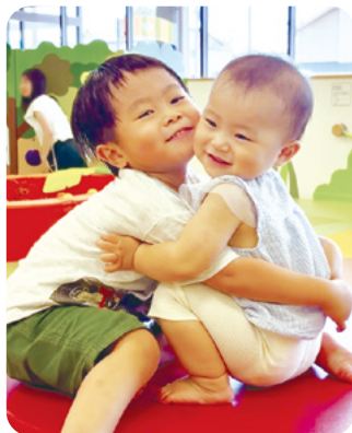
けいしん みこと 鹿又 繫苺ちゃん、美琴ちゃん ケンカもするけど大好き！