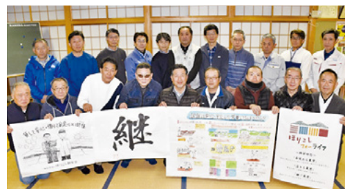
堀越集落の皆さん

このような法人2階建て方式による持続可能な集落営農活動などが評価され、この度の受賞に至りました。