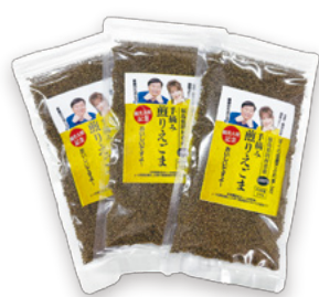
夢グループのコンサート等で販売しているコラボ商品

すが、残念ながら田村市はそれがありません。田村市が今一番PRしたいものは何でしょうか。「これが主役だから、PRに力を入れていきたい」といったものを教えてください。 市長 まずは、あぶくま洞を拠点に田村市観光の魅力を発信し、市内を周遊してもらいたいと考えています。 石田 僕だったら、あぶくま洞の入洞者数を伸ばすために、あぶくま洞に生息する生き物をモチーフにした、ぬいぐるみを作って売り出しますよ。洞内に入っただけで勝負ではなく、あぶくま洞のイメージを違った意味でPRすることも必要でしょう。ぬいぐるみを動画や交流サイト（SNS）を使ってPRし、多くの人の注目を集める仕掛けを考えますね。 市長 スカイパレスときわでは、タガメを入れたサイダーや食用コオロギをちりばめたアイスを提供したところ、多くの方から注目を集めました。