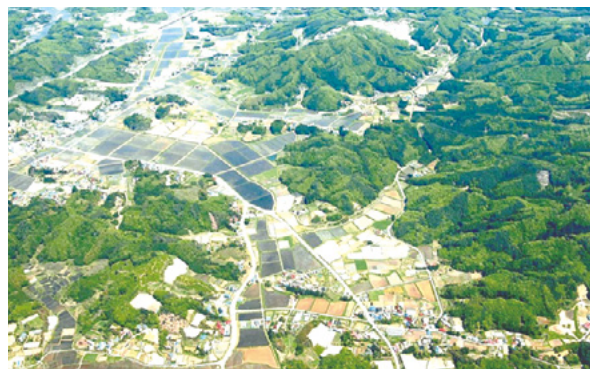
圃場整備後の堀越集落

平成6年に基盤整備事業の推進母体である「堀越環境整備委員会」が設置され、集落営農活動がスタートしました。